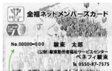
会員番号・会員氏名が入ります